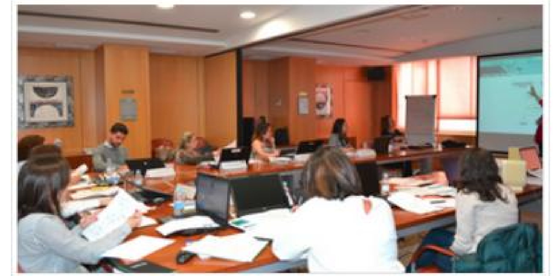
Imagen 1. Formación FoCo en el Consejo General

Se mantuvieron 12 sesiones de monitorización y feedback entre FoCo y equipo investigador para obtener retroalimentación sobre la viabilidad y puntos de mejora a lo largo del proyecto. Los FoCo además realizaron 5 sesiones de capacitación continua de los farmacéuticos en su provincia. El trabajo fue registrado en la plataforma FoCo en NodoFarma Asistencial.